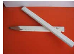
9. ดินสอช่างไม้