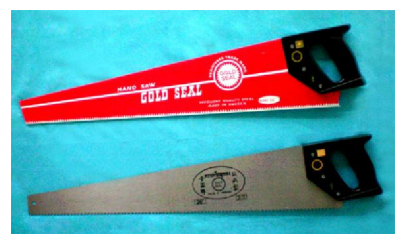
15. เลื่อยตัดดา