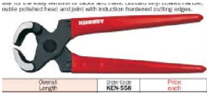
4. คีมปากนกแก้ว