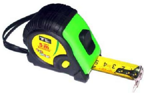
10. ตลับเมตร