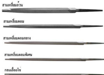
11. ตะไบแทงเลื่อย