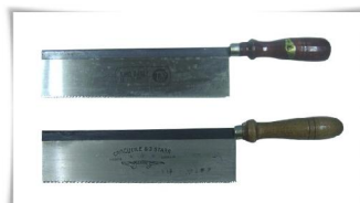
14. เลื่อยล่อ