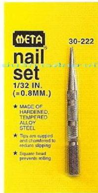
19. เหล็กส่งตะปู