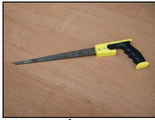
16. เลื่อยทางหนู