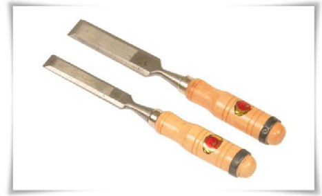
18. สิวปากบง