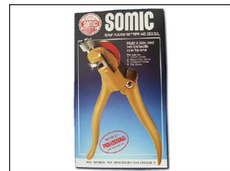
12. คัดคลองเลื่อย