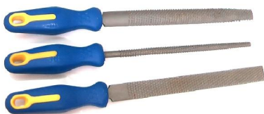
13. บุ้งถูไม้