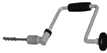
17. สว่านข้อเสือ