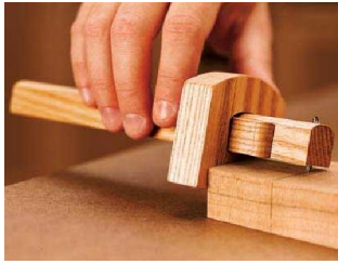
2. ขอนัดไม้